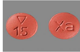
أقراص زارلتو 15 مجم